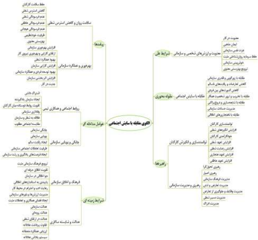
شکل ۲- الگوی مقابله با سایش اجتماعی در مدیران مدارس دوره ابتدایی بر اساس نظرات خبرگان

در ادامه جهت اعتباریابی کمی و بررسی برازش الگو و استفاده از آزمون‌ها ابتدا شرایط پارامتریک یا ناپارامتریک داده‌ها مشخص شدند. جهت بررسی توزیع نرمال یا غیر نرمال داده‌ها از آزمون کولموگروف-اسمیرن استفاده شد که نتایج آن به شرح جدول زیر بود: