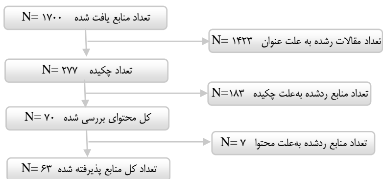
شکل ۱. جستجو و انتخاب مقالات مناسب

مرحله سوم) جستجو و انتخاب مقالات مناسب: بدین منظور بیش از ۱۷۰۰ مقاله براساس موضوع و عنوان بررسی شد که از این تعداد با بررسی و تفکیک اسناد براساس عنوان متمرکز بر موضوع، تعداد ۱۴۲۳ سند، کنار گذاشته شد چرا که عنوان و موضوع آنها، در حوزه مرتبط با موضوع پژوهش حاضر قرار نداشت. ۲۷۷ سند علمی-فنی باقی مانده، مورد بررسی چکیده قرار گرفت تا با بررسی دقیق تر، پژوهش‌هایی که می‌تواند محتوای تحلیلی لازم را فراهم آورد جداسازی شود. در حین بررسی چکیده‌های پژوهش‌ها، تعداد ۲۰۷ مقاله دیگر نیز از بررسی خارج شد. در نهایت، با مطالعه سریع محتوا و محورهای کلیدی مقالات، ۷ مقاله رد گردید. نهایتاً ۶۳ مقاله در تحلیل باقی مانده و نتایج بررسی آنها، یافته‌های پژوهش حاضر را شکل داده است. این مقالات حداقل در حوزه خودتوسعه‌ای، علوم اعصاب و علوم شناختی و با تأکید بر رهبری دانشگاهی قرار داشته‌اند و با تحلیل استنباطی و تعمیق در آنها ارتباطات بین آنها نسبت به موضوع پژوهش شناسایی شده که منجر به انتخابشان گردید.