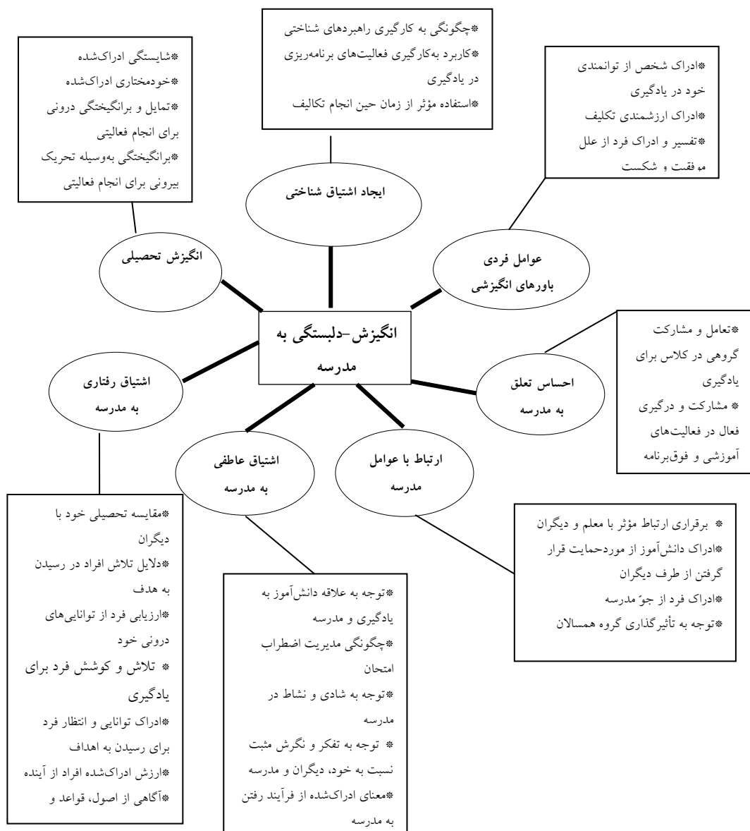
شکل ۱: شبکه مضامین انگیزش-دلبستگی به مدرسه