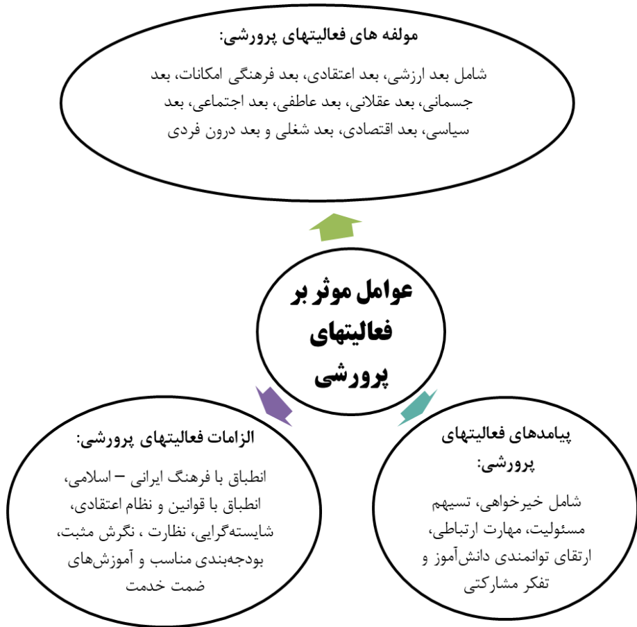
شکل ۱) مدل مفهومی عوامل موثر بر کیفیت فعالیتهای پرورشی در مدارس (مطالعه موردی: مدارس ابتدایی شهر تهران)