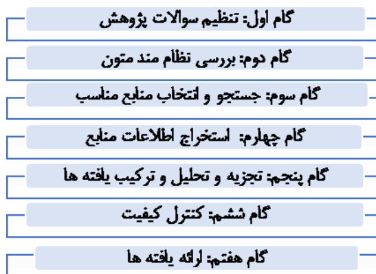
شکل ۱: مراحل هفت گانه روش کیفی فراترکیب (سندلوسکی و باروسو، ۲۰۰۷)

روش از یک الگوی هفت مرحله‌ای برای تحلیل اسناد استفاده می‌کند. در شکل ۱ مراحل هفت گانه این الگو نشان داده شده است: